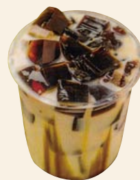
コーヒーゼリー黒糖ミルク