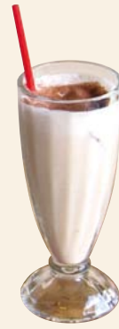
フレッシュバナナジュース