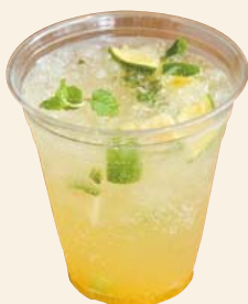
パッションモヒート