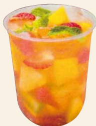
季節のフルーツティー