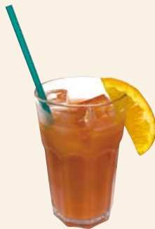
ブラッドオレンジジュース