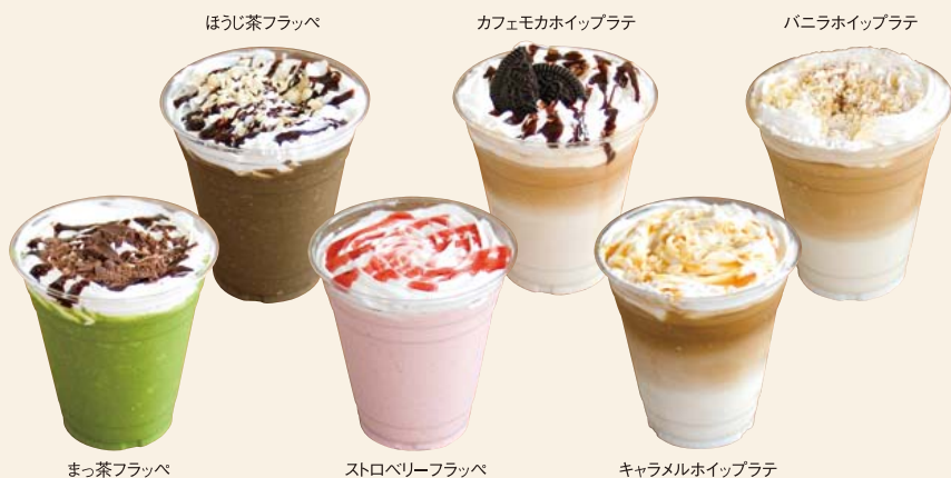
ほうじ茶フラッペ