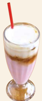
ストロベリーラテ