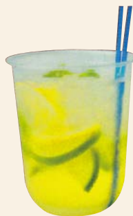
レモンライムミント