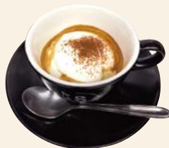
カフェコンパンナ